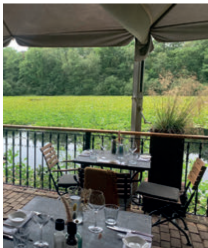
Cafe Restaurant Rust Wat

Zowel Cafe Restaurant Rust Wat als Bistrôt Chapeau hebben deze eervolle titel mogen ontvangen. Gefeliciteerd! In totaal zijn er dertien restaurants in Nederland die een Bib Gourmand hebben gekregen. De horecalockdown heeft uiteraard ook gevolgen gehad voor de inspecties, maar Michelin heeft gedurende meer dan zes maanden in Nederland kunnen rondtoeren om de keuze voor 2021 te maken.