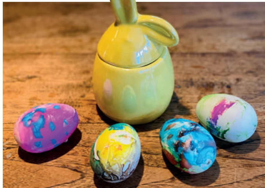
Paaseieren geschilderd door Phileine (6 jaar)