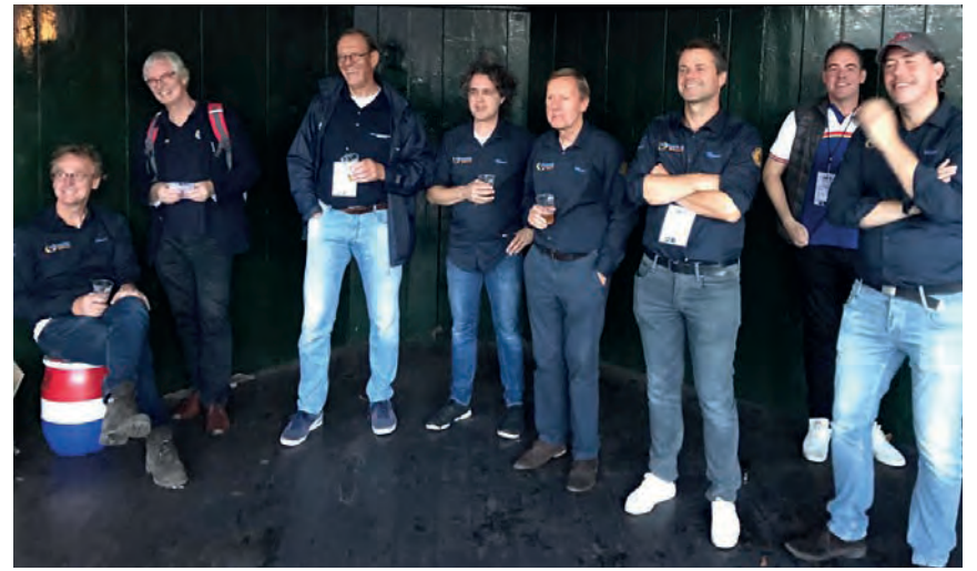
Muziekent: Vrijwilligers in actie voor het Alzheimercentrum Amsterdam

Zo hebben ze zich onder meer in de coronaperiode actief ingezet voor de Voedselbank, zamelen ze na iedere zomer oud/vreemd geld in en hebben ze de handen ineengeslagen met De Vrienden van Het Gooi Bevrijd om de bevrijdingstocht op 5 mei en het logies van veteranen in Blaricum en Laren mogelijk te maken. De opbrengsten van hun acties komen onder meer ten goede aan het Alzheimercentrum Amsterdam, voor het project Fight for Sight aan een oogkliniek in Azië alsook lokale goede doelen zoals de imkersvereniging, Stichting Papageo en de plaatselijke voedselbank.