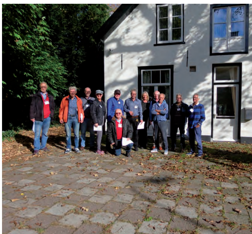
Het team van opgeleide energiecoaches van de Hut van Mie.