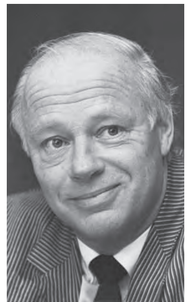
In herinnering aan Bernard Haitink Foto is genomen in 1984.