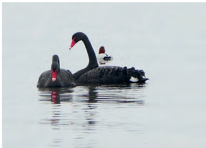
Twee zwarte zwanen en een tafeleend in het water bij het Stichtse Strand aan het Voorland. Een bijzonder Blaricum's wintertafereel.

Omwille van de gezondheid van de bezoekers is in de modernste klimaatbeheersings-apparatuur geïnvesteerd die voor de nodige ventilatie in Het Theater zorgt. Het Theater zal zich verder strikt houden aan de richtlijnen van de overheid, waardoor veilig van de voorstellingen kan worden genoten.