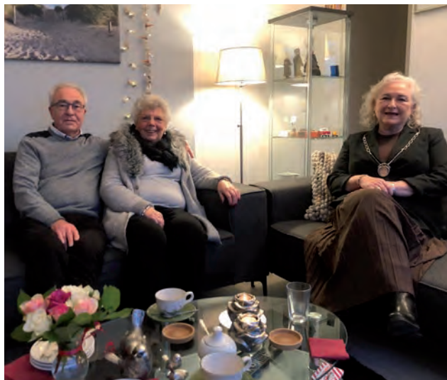
Echtpaar Vos-Smeenck met de burgemeester op 30 december