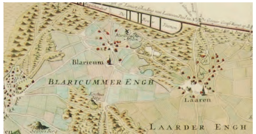
Deel historische kaart van Gooiland. Uitgegeven tussen 1725 en 1734 door Reinier en Joshua Ottens.

Hoe zit het met de oudste en dikste bomen van Nederland? De Dikke Boom van Verwolde staat in Laren Gelderland, een zomereik van 450 jaar. Deze oude Dikke is hol en daardoor een prachtige woonplaats voor vogels, onder andere kerkuilen, vleermuizen, eekhoortjes, kevers, mossen, schimmels en bacteriën. In Sambeek staat de dikste boom, een enorme linde met een omtrek van acht meter. De kroon werd door zware stormen weggevaagd en het was maar de vraag of hij zou overleven. Uit de holle stam ontsproot een nieuwe stam. Deze werd in de jaren zeventig verankerend met ijzeren stangen en met zware tak-