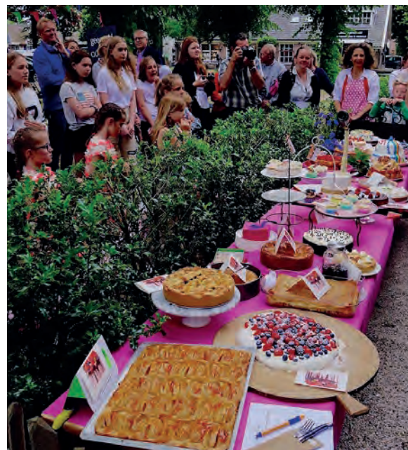
Heel Blaricum Bakt

Blaricum, entertainment, muziek, sport en algemene kennis. Door corona is er helaas nog geen vervolg aangegeven. 'Maar we staan in de startblokken hoor, hopelijk later dit jaar.' Ook kregen ze in 2019 jong en oud aan het bakken met de wedstrijd Heel Blaricum Bakt en jaarlijks prikken ze in ons dorp afval voor de actie EndPlasticSoup. Nieuw is het Midzomerfeest in juni. Dit belooft een mooi dorpsfeest te worden. Ze houden ons op de hoogte. Alle opbrengsten gaan dit jaar naar het Goois Natuurreservaat en Stichting Anne Bo ( stichtinganne-bo.nl ).