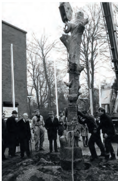
De Erfgooiersboom op zijn tijdelijke plaats naast het Singermuseum in Laren

Hij heeft het later gebracht tot burgemeester van Berghem, Vlijmen en Hilvarrenbeek en tot waarnemend burgemeester van Sluis-Aardenburg. Vervolg pagina 2