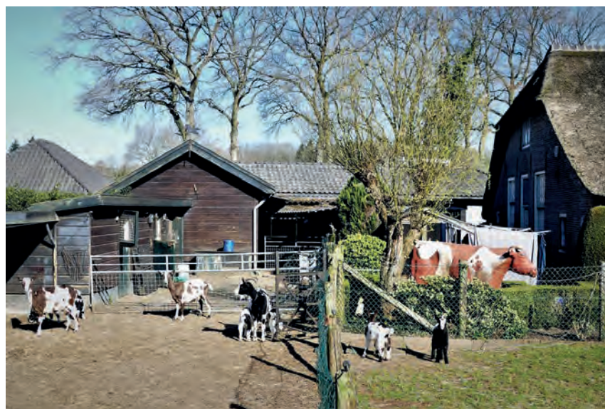
Bij Butje en Thea de Gooijer lopen de jonge geitjes heerlijk op het erf. Genieten van de lente bij een van de weinige echte boerenbedrijven in Blaricum.