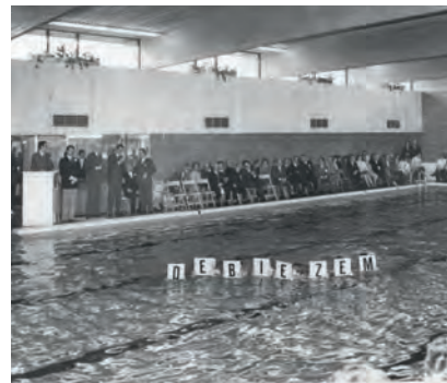
Opening de Biezem 15 april 1972

Kijk voor het hele feestprogramma op debiezem.nl/50-jaar