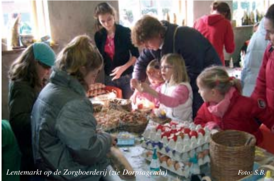
Lentemerket op de Zorgboerderij (zie Dorpsagenda)