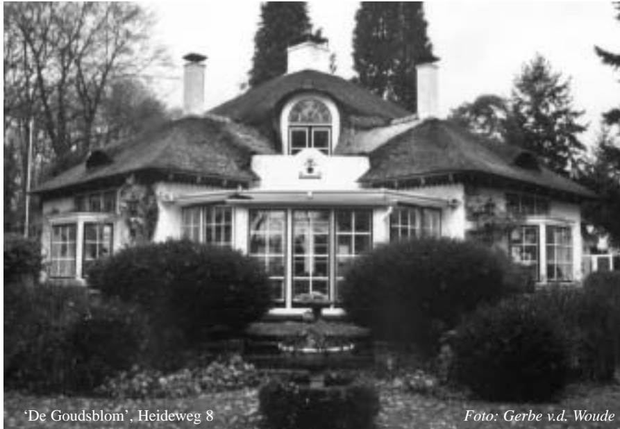
'De Goudsblom', Heideweg 8