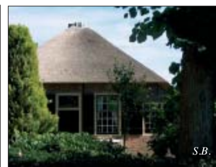
Aan de Mosselweg

Thuiszorg Gooi en Vechtstreek: diverse cursussen. Aanmelding: 035-6924495, cursussen@tgvgzorg.nl en info.tgvleden.nl .