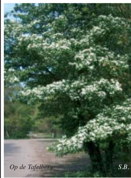
Op de Tafelberg