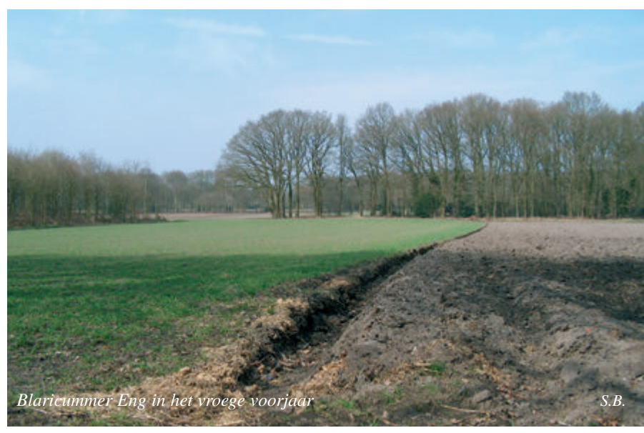
Blaricummer Eng in het vroege voorjaar