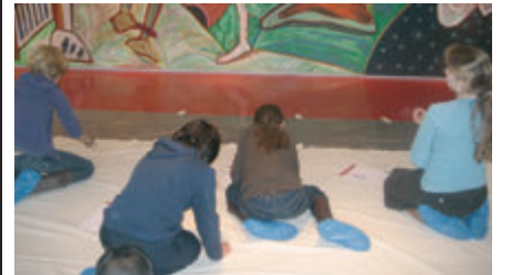
Kinderen van 'witte' en 'zwarte' school samen aan het werk

Kinderen van de Bernardusschool uit Blaricum en kinderen van de Haagse basisschool Het Startpunt schilderden maandag 21 januari jl. samen vier grote wanddoeken van zes bij twee meter in het Letterkundig Museum in Den Haag.