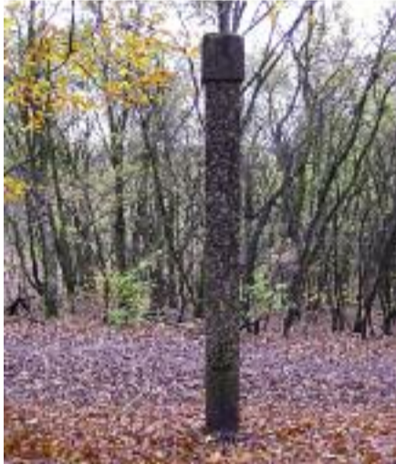
Grenspaal Blaricumse kant

Deze buur aan de westkant van ons is wel de lastigste 'landjepikker' geweest van al onze burenen. Men wilde een grens verleggen die al eeuwen bestond. Net als de andere grenzen trouwens. Alleen liep deze grens over de meent die toen nog onbewoond was. Toen de Oostermeent bebouwd werd, konden de Huizers hun expansiedrift niet meer onderdrukken en zij wilden het hele Blaricumse gedeelte van de meent bij Huizen inlijven. Nadat de Tweede Kamer het wetsvoorstel voor