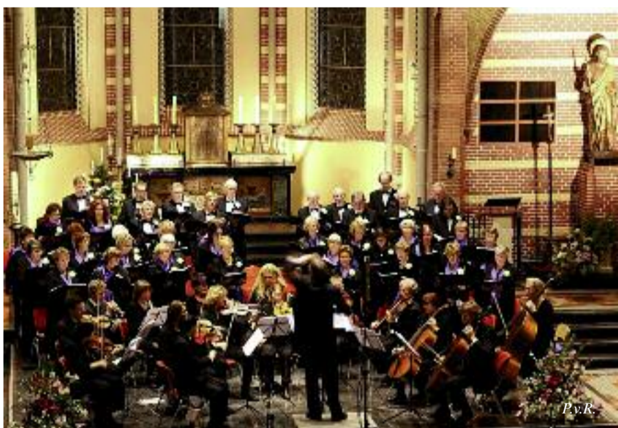
Blaricums Gemengd Koor 25 jaar!

Torenhof Prot. diensten: elke 1 e en 3 e woensdag v.d. maand om 10.00 uur. Kath. diensten: elke 2 e en de 4 e , en event. 5 e woensdag v.d. maand om 9.30 uur. Iedereen is welkom!