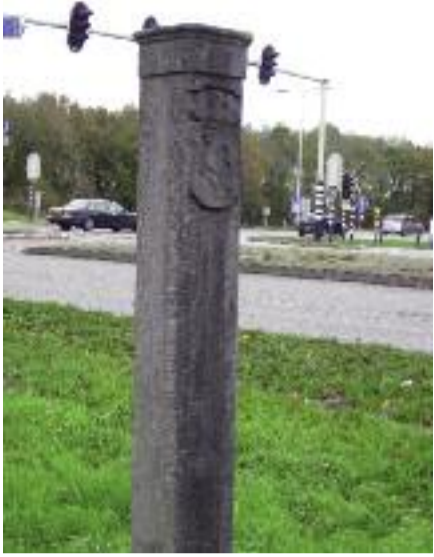
Leeuwenpaal: N.-H. kant

Dit is een onderwerp dat kan uitnodigen tot veel benaderingen. Ik wil het benaderen vanuit het verleden. Wat hebben onze burenen en de daarbij behorende grenzen in het verleden voor ons dorp tot gevolg gehad? Welke gevolgen zullen er in de toekomst nog komen?