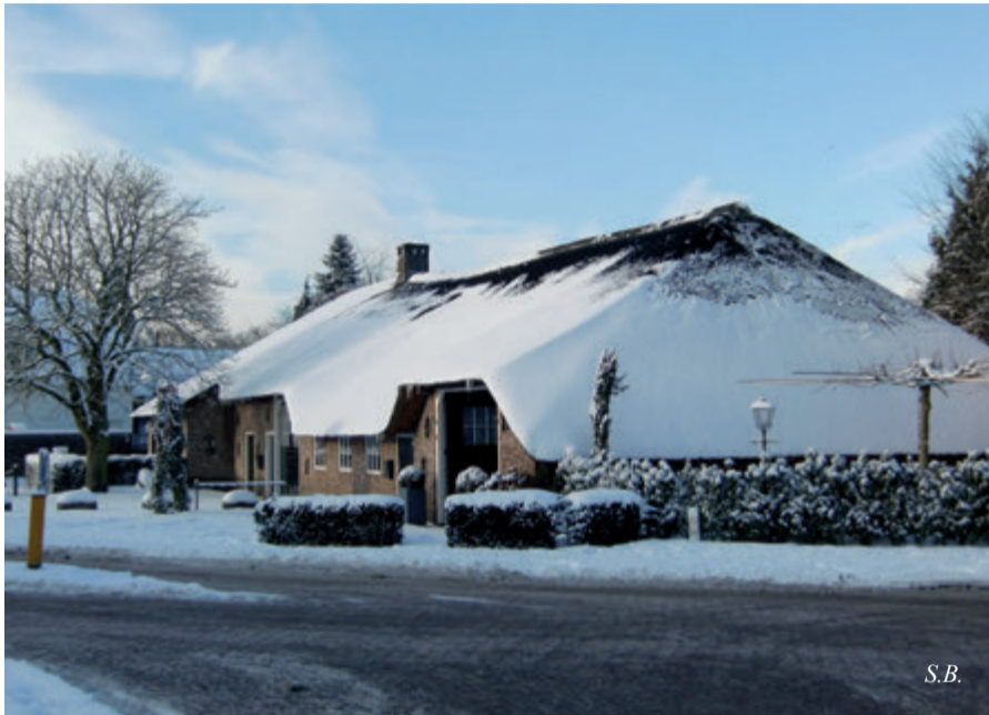
Winter 2010 in het centrum van Blaricum