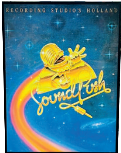
Replica van de lichtbak Soundpush Studio die nu in Het Theater hangt