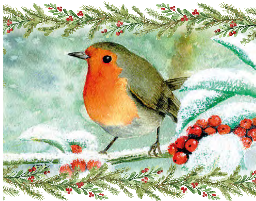
ILLUSTRATIE: HENK VAN BORK

Hei & wei wenst u heel fijne feestdagen, veel gezelligheid en alle goeds voor 2021!