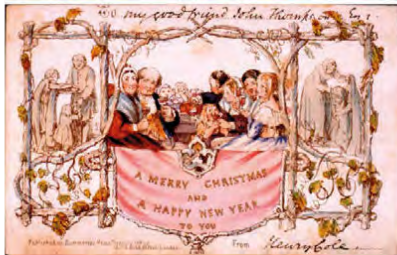
De eerste kerstkaart

Sinds de komst van de computer, tablet en smartphone worden er steeds minder papieren kerstkaarten verstuurd. Tegenwoordig worden veel kerst- en nieuwjaarswensen per email, whatsapp of via social media verstuurd, natuurlijk wel met bijgevoegde foto's, emoji's of GIFjes (graphics interchange format)! Zou het niet mooi zijn om, nu we door de strenge coronamaatregelen elkaar met de feestdagen niet allemaal persoonlijk kunnen ontmoeten en we wellicht wat meer vrije tijd hebben, onze dierbaren massaal een mooie handgeschreven kerstkaart te sturen met een warme kerstgroet en een welgemeende nieuwjaarswens? Misschien ouderwets, maar o zo fijn om te ontvangen! Ik wens u langs deze weg, ondanks de bijzondere omstandigheden, heel gezellige feestdagen en alle geluk en voorspoed voor 2021!