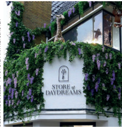
DECORATIE BIJ JELLE

Ananda is niet alleen een succesvolle ondernemer, maar ook een mensenmens. Zo zit zij bij de Ladies Circle Gooi, een serviceclub voor ambitieuze vrouwen uit onder andere Blaricum, waar zij veel acties doet voor goede doelen. In de toekomst wil ze de Curious Kids Foundation oprichten om kinderen te ondersteunen die het moeilijk hebben en onder de armoedegrens leven. 'Mijn allergrootste droom gaat in 2024 uitkomen, de Curious Kids Foundation gaat van start. We gaan de kindermoeie in Nederland aanpakken, met geschikte en betrokken mensen, echt in actie komen. Samen komen we er. The future belongs to those who believe in the beauty of their dreams.' storeofdaydreams.com