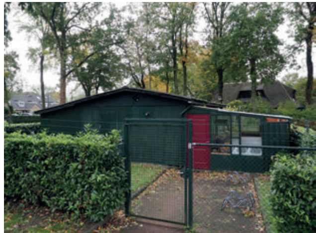
In december 2021 opende de Kledingbank Blaricum haar deuren aan het Hendrik Smitlaantje 2. Een eigen plek, maar wel antikraak