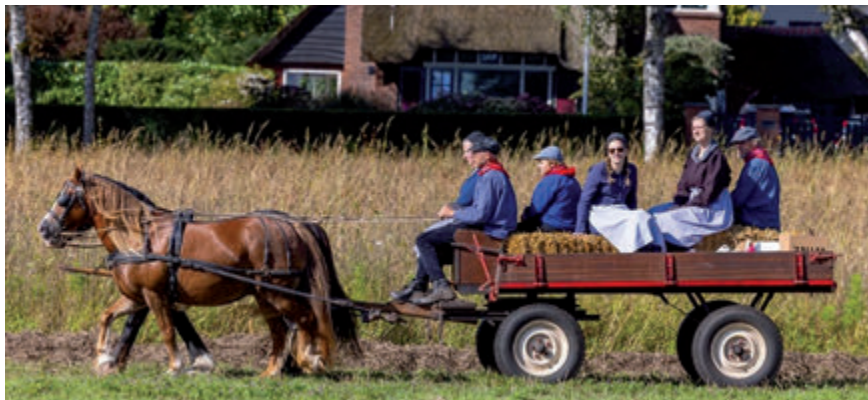
De vrijwilligers van de Dag van het Werkpaard ontvingen in 2023 de Ludenpenning.

Een idylle van groen, rust en tegelijkertijd is Blaricum een bruisend dorp. Ook 2023 is een jaar vol evenementen geweest, zoals de kermis, de Gooische Rally, de aspergediners, de wijnproeverij, het Papageno Zomerconcert en het Midzomerfeest. Extra bijzonder was dit jaar de uitreiking van de prestigieuze Ludenpenning aan de vrijwilligers van de Dag van het Werkpaard. De prijs werd toegekend voor hun bijzondere inzet voor het behoud van het cultureel en maatschappelijk erfgoed.