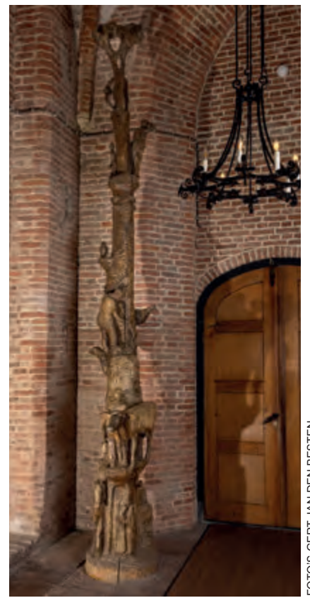
De erfgooiersboom in de Dorpskerk

Muziekent. Om dit te financieren zijn destijds een aantal bronzen boompjes van 40cm gegoten en verkocht voor 240 gulden. Deze kleine replica's zijn niet meer te krijgen. Dezelfde initiatiefnemers hebben daarom later weer een boompje gegoten, nu van 29cm en op een marmeren voet. Deze kan voor 375 euro besteld worden bij de Historische Kring Blaricum via secretaris@HKBlaricum.nl