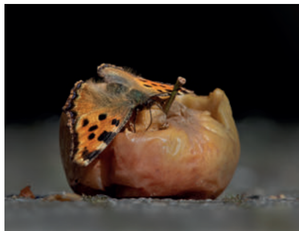
De grote vos op een rotte appel