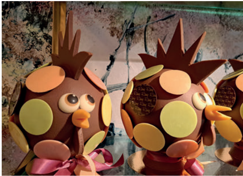
Een feestje: prachtige paashazen, paaseieren en paaskuikens bij Patisserie Remy

'Paasfeest is voor mij de spil waar het jaar om draait. Op Paasfeest vieren we dat het leven sterker is dan de dood. Daar bedoel ik niet mee dat de dood er niet toe doet, maar de dood heeft het laatste woord niet als het gaat om de waarde van het leven. Samen mogen mensen gestalte geven aan het levende lichaam van Christus in de wereld. Zij kunnen lief en leed leren delen in Gods levenslicht. De Heer is waarlijk opgestaan!'