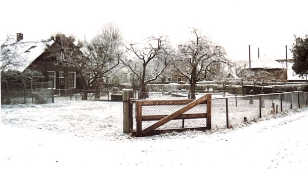
Met dank aan Joop van Gestel voor het aanbieden van deze kleurendruk