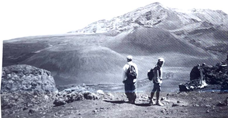
"De krater van de Haleakala-vulkaan"