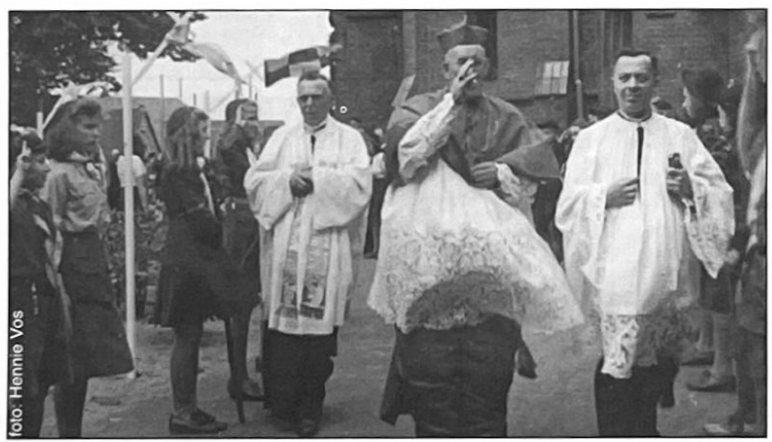
Kardinaal De Jong neemt deel aan de Sacraments Processie 1947

De Processie Met het ouder worden komen er vaak gedachten op je af, van zo was het eens en je ziet om je heen dat in het dorp waar in je geboren en opgegroeid bent, het een en ander gaat veranderen. Begin vijftiger jaren telde ons dorp nog iets van zeventig boeren, kleine en grote bedrijven. We zijn er zelf ook mee bezig geweest, ze zijn nu nog op een hand te tellen. Natuurlijk gaat er dan iets veranderen. De Meenten zijn praktisch verdwenen. Mensen moeten kunnen wonen. Boerderijen worden verkocht en verbouwd, maar je kunt nog wel zien hoe het ooit is geweest. Over 't Gooi en zijn bewoners is veel geschreven. Gooiers stonden bekend om hun koppigheid, vasthoudend aan hun tradities en beginselen. We waren in mijn jeugd een overwegend Katholiek dorp. Maria