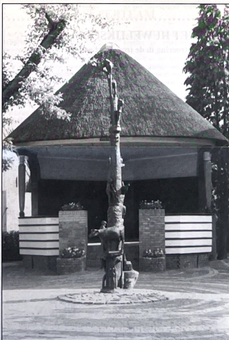
Het was weer groot feest bij de Muziektent in hartje Blaricum. Wist u dat dit gebouwtje ontworpen is door architect Symons en onder monumentenzorg valt.

Burgemeester De Winter stelde onlangs heel duidelijk dat De Bijvanck al lang niet meer een soort aanhangsel van Blaricum is, maar een volwaardige wijk. Prima: de wijk Bijvanck. Hoe noemen we dan de rest van Blaricum? De wijk Het Dorp, de wijk Dorp, de wijk Oud Blaricum, de wijk Het Oude Dorp? Mijn suggestie is: de wijk Blaercom. Twee karaktervolle en historisch verantwoorde namen, die ook nog 's met elkaar en met de dorpsnaam allitereren. pvr