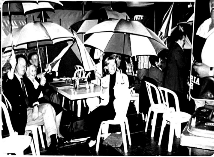
Vrijwilligersdag. Iedereen ontvangt een gemeenteparaplu.