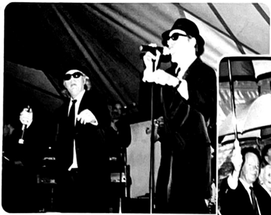
De Blues Brothers Dedication Revue brengen entertainment van het hoogste niveau.