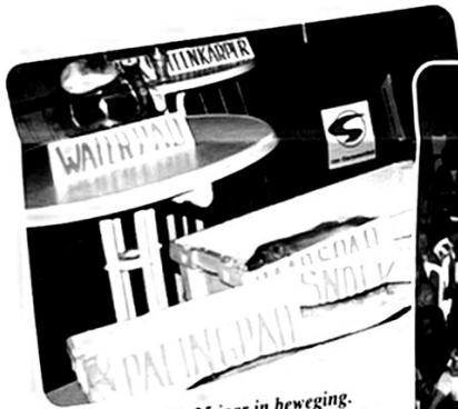
Bijvanck 25 jaar in beweging. Alle straten zijn LETTERLIJK te zien.