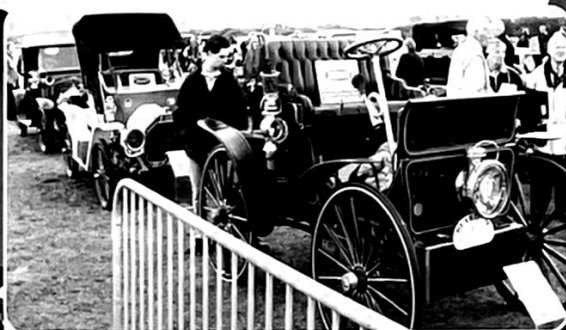
Meer dan honderd mooie, grote, kleine, gekke, grappige en sjeke Oldtimers en hun eigenaars doen mee aan de slotmanifestatie van de 2 weekse tent-millenniumviering