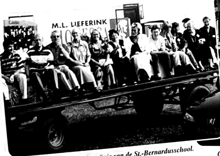
Even uitrusten tijdens de reünie van de St.-Bernardusschool.