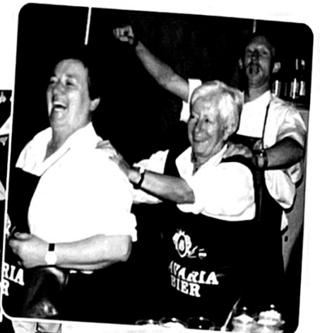
De barmedewerkers vermaken zich kostelijk.