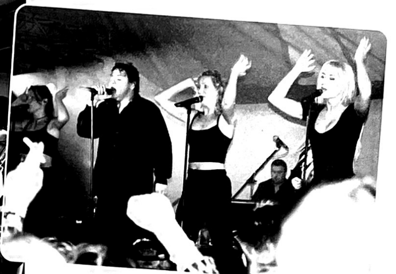
Rene Froger zet weer de hele tent op stelen.