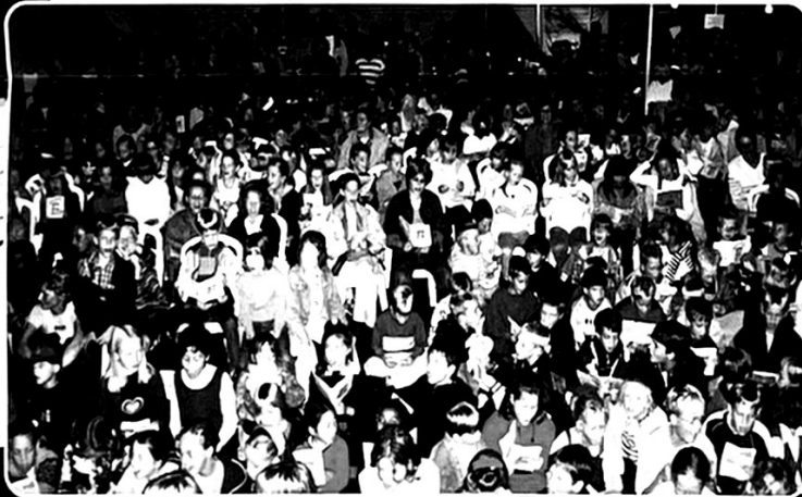
Bijvanck 25 jaar in beweging. Meer dan 1000 mensen komen in beweging vanuit een springlevende Bijvanck.