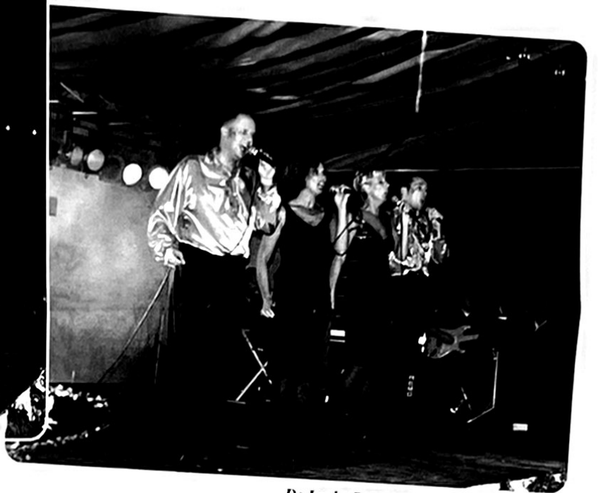
De Lucky Boys and Girls luisteren muzikaal deze opening op