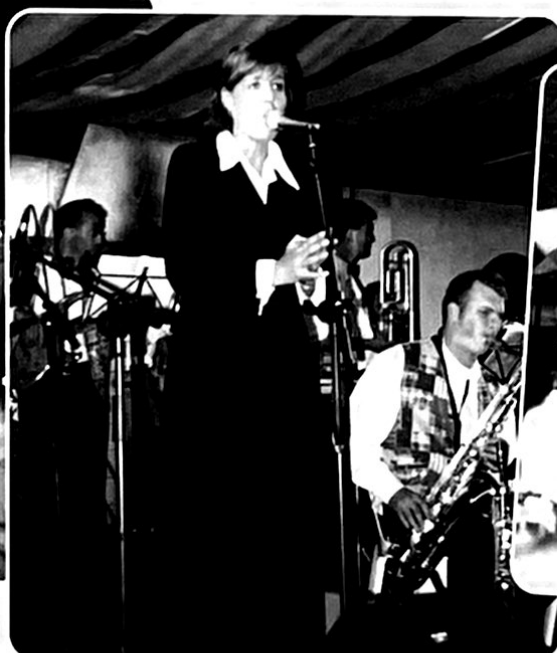
Spetterende avond met de Big Band Beeg.