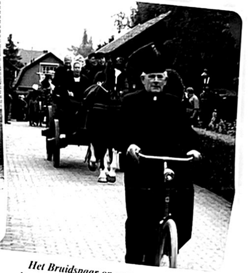
Het Bruidspaar op weg naar de huwelijksvoltrekking voorafgegaan door "de pastoor".