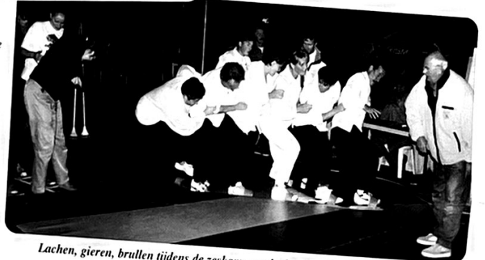
Lachen, gieren, brullen tijdens de zeskamp op de dag van de sportverenigingen.