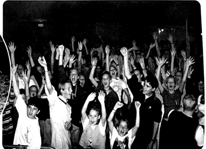
Veel enthousiasme bij de Veronica Drive-In show.