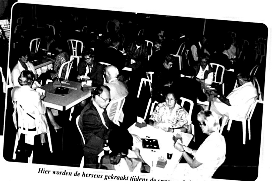
Hier worden de hersens gekraakt tijdens de spannende bridgedrive.