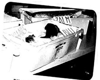
Bijvanck 25 jaar in beweging. Alle straten zijn LETTERLIJK te zien.