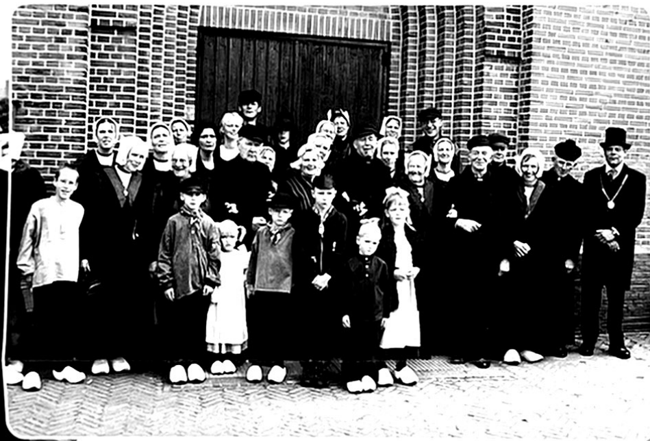
De hele bruidstoet van de Boerenbruiloft.