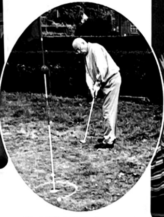
De Golfdag. Putten is een van de moeilijkste onderdelen, zeker op deze hobbelige ondergrond.