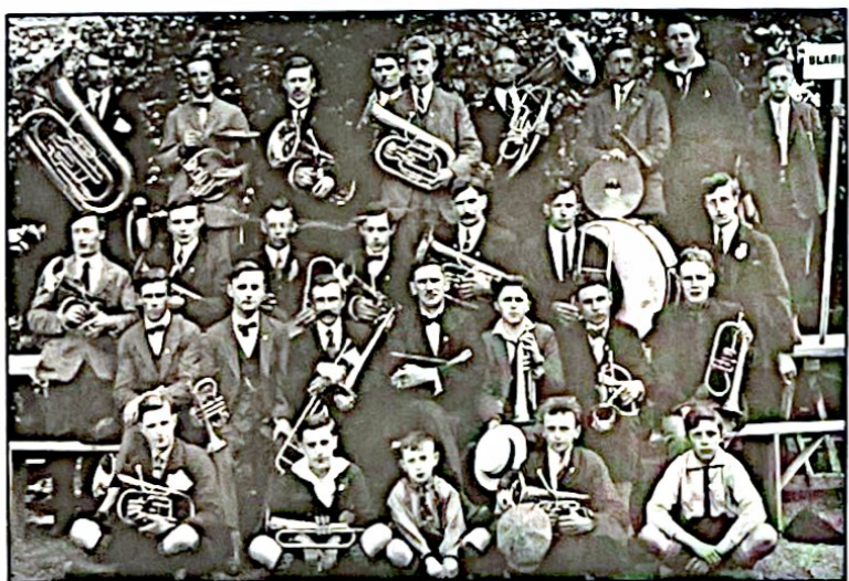
De Blaricumse Muziekvereniging (± 1936). Kent u de muzikanten?

Tijdens de Blaricummerie op zaterdag 29 april a.s. opent de Historische Kring een nieuwe tentoonstelling. Het thema is dit jaar: "onbekende foto's uit eigen collectie". De foto werkgroep van de Kring is momenteel bezig de fotocollecties te catalogiseren en zodanig vast te leggen, dat een maximale toegankelijkheid ontstaat. Bij deze operatie is gebleken, dat van een aantal opnamen gegevens ontbreken. Dit kan personen betreffen, die op de foto's voorkomen, de plek welke is gefotografeerd, dan wel de activiteit of aanleiding voor de opname. Het publiek kan genieten van een groot aantal interessante opnamen uit de oude doos en wordt tevens gevraagd na te gaan of men gegevens over de betrokken foto's kan verstrekken. Naast de fototentoonstelling zullen in de Blaricumse "huiskamer" weer een aantal klederdrachten te bewonderen zijn, samengebracht en van informatie voorzien door de klederdrachten groep.