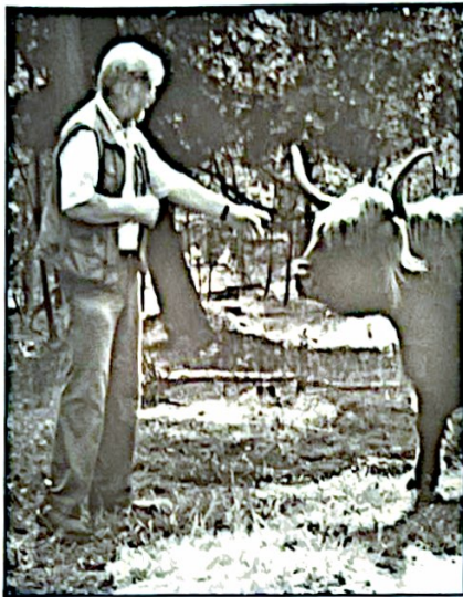
Koe met limonade tijdens het voorlezen

schape is het oudste ras van West-Europa en heet "Het Drents Heide Schape". Dit ras bestaat zeker al drieduizend jaar. Zowel de mannetjes als de vrouwtjes hebben hooftjes. Het is niet alleen het kleinste schaapje in Nederland maar ook het kleinste in aantal. Als de subsidies voor de kuddes zouden worden stopgezet wordt dit soort zeker bedreigd. Wij fokken ook zelf. We plannen het zo dat er ieder jaar een maand voor de Pasen de lammetjes geboren worden. De lammetjes van "het Drents Heide Schape" zijn bont (de schutkleur). Bij onze kudde loopt één gecasteerde ram, dat noemen we een hamel. Anders is de kudde niet aangekleed. Wij hebben ook altijd een oneven aantal zwarte schapen. Waarom? Ja, waarschijnlijk gewoon bijgevolg. Scheren doen we 's zaterdag in juni. Dat is een feestelijk gebeuren. We doen het op de ouderwetse manier met scharen. Wij hebben op dit moment 65 schapen maar in de winter hebben we 45 schapen. Al onze dieren leven van het grazen op de hei. Alleen bij heel extreem weer in de winter voeren wij ze bij. Nogmaals, het belangrijkste van mijn werk is goed opletten. De kuddes lopen door elkaar heen. Ze gaan niet met elkaar om. De dieren grazen nooit 2 dagen in hetzelfde gebied. Elke dag zoeken ze een ander plekje op. Deze kuddes hebben hier een ideale omgeving. Ze kunnen kiezen waar ze zin in hebben. De bokken en de Hooglanders slapen altijd buiten. Mijn favoriete bezigheid is