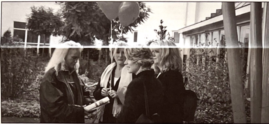
Vertegenwoordigers van de actiegroep Hart voor Blaricum voor het Gemeentehuis, nadat zij een taart in de vorm van de maquette van de nieuwe school en een lijst met handtekeningen hebben overhandigd.

Reactie (B) Misschien juist. De wet verbiedt echter kinderen uit andere gemeenten de toegang tot een openbare basisschool in Blaricum te weigeren zolang er plaats is. Een gemeente kan bij ruimtegebrek wel een terughoudend beleid voeren. Dit is ook met de directie van de OBB besproken.