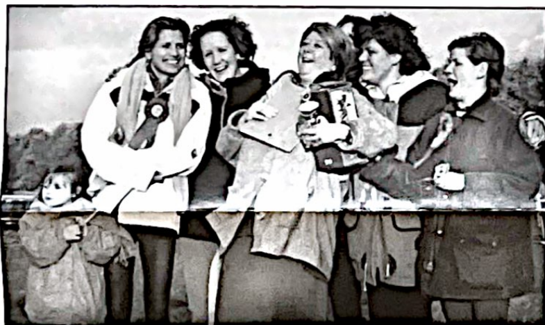
De huldiging van de kampioen door doosgenoten

ouderwetse kijkdoos en een beker mag zij een jaar lang in haar bezit houden. Het lintje en de plaquette vormen een blijvende herinnering voor haar. Het waren niet alleen de ouwetjes die het nog best deden. Ook de jeugd heeft die dag haar beste (paarden)beentje voorgezet. In een volge lieten zij prachtige staaltjes van hun kunnen zien.