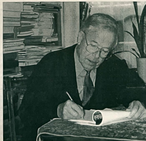
Historische Kring Blaricum