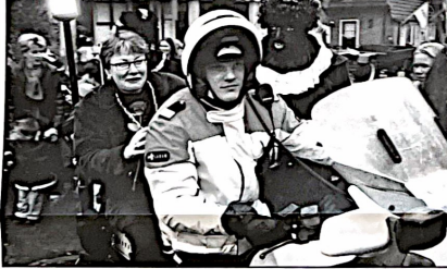
Burgemeester arriveert bij de muzikale groep om Sinterklaas te verwelkomen.