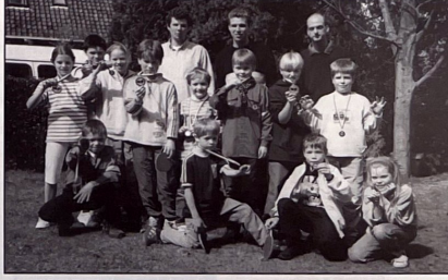
Jeugdspelers en trainers van ITV Vitus

Programmaboekje Najaar 2002 is uit! Inschrijving vanaf 3 juni 2002 op Eemnesserweg 17B Laren - 5123/99 Geen boekingtoeslag! Bel even en wij verzorgen onmiddellijke nalevering.