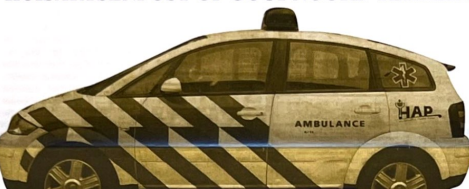
De medistaf van de huisartsenpost Gooi-Noord. De knegle utole is voorzien van communicatie apparatuur, zwaailicht en navigatiesysteem

assistenten. Zij bevoorleden of het nodig is dat men de huisartsenpost bezocht of dat de huisarts naar hen toekomt. Bij twijfel kunnen zij ruggespraak houden met een altijd aanwezige supervisiearts. Ook dat huisartsenzoek zijn drie knagelge medistaf met chauffeur aanwezig, die in Noord- en Zuid-Gooi en Weesp-Neder-