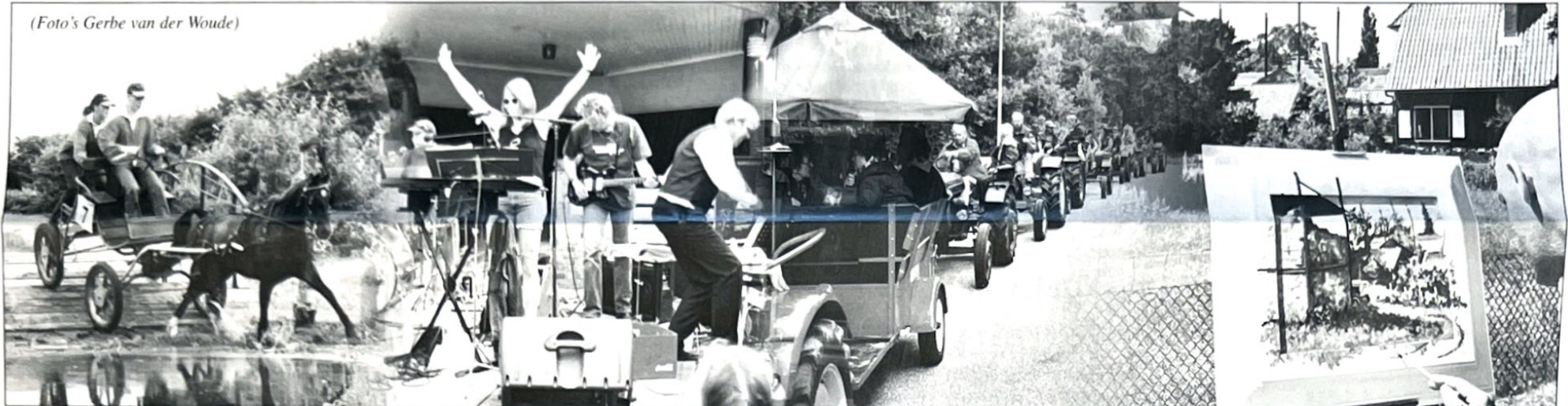
De maand juni stond weer bol van gezellige activiteiten. Hier een impressie van de menwedstrijden, het muziekfeest bij de muziektent, de historische tractorenoptocht en de schilderswedstrijd.