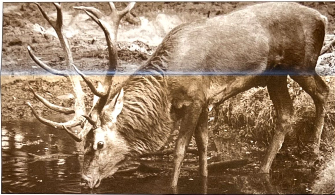
Een prachtig edelhert met z'n machtig gewei te zien op stille plekken in de bossen in en rondom 't Gooi