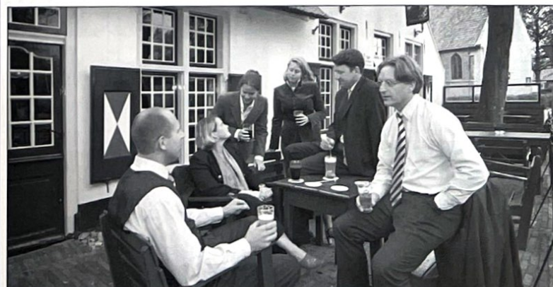
Het team van Voorma en Walch Makelaars in het Gooi