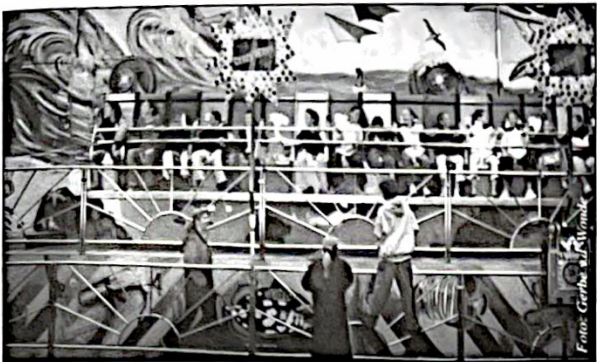
Zoals vanouds waren de kermisdagen weer één grote happening.