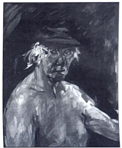
Zelfportret, aquarel 65x48 cm., 2000