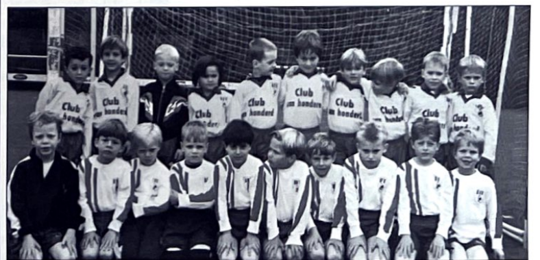
Bengels team A + B seizoen 2002/03

heeft BVV'31 een Bengelafdeling voor spelertjes die vóór 01-01-04, 5 jaar worden en op 01-09-03 nog geen 6 jaar zijn, maar ben jij 6 of word jij dat vóór 1 september dan kan je worden ingedeeld bij de F pupillen. De Bengels gaan eerst een tijdje trainen en gaan dan ontmoetingswedstrijden spelen met andere teams uit de omgeving met de mooie namen als Kabouters / Gigantjes / Beetjes / Smurfen etc. onder het motto van voetballen met elkaar en niet tegen elkaar.