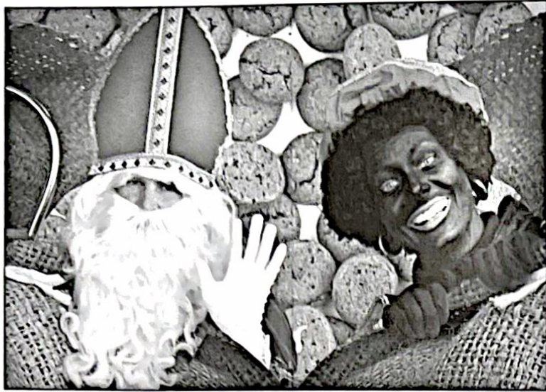
Op zaterdag 22 november is het weer zover. Dan zal Sinterklaas op zijn paard ons dorp opnieuw bezoeken en zal hij vergezeld van zijn onmisbare Pieten om 11.00 uur bij de Malbak in de Bijvanck zijn en om 13.30 uur bij de muzikent in het oude dorp.

Apothekers en huisartsen hebben samen afspraken gemaakt om zoveel mogelijk op werkzame stofnaam voor te schrijven en af te leveren. Zo kunnen we de stijging van de kosten van geneesmiddelen in de hand houden en blijft er bij de verzekeringen financiële ruimte over voor echt nieu-