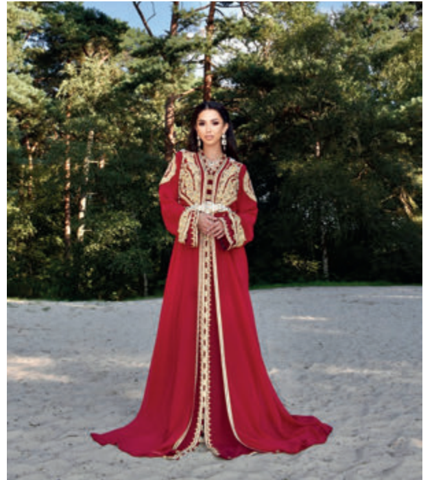
Een model met een prachtige kaftan van Jihane

Op feesten dragen de vrouwen vaak kaftans. Mooie, lange, vaak ruime gewaden, recht of licht uitlopend en met lange of halflange mouwen. Kaftans zijn een culturele uiting. De kaftan werd in de 6e eeuw door de migratie van Arabieren naar Noord-Afrika verspreid naar landen zoals Algerije, Tunesië en Marokko. Door Noord-Afrikaanse stammen werd het kledingstuk overgenomen en ging zo deel uitmaken van de klederdracht. Jihane vertelt over de verschillende types: 'Je hebt de eendelige jurk, de kaftan zoals hierboven beschreven. Deze wordt vaak op feesten gedragen. Dan is er de tweedelige jurk, een taqchita, deze bestaat uit een onderjurk van meestal een fijne stof, de tahtia, met daaroverheen een overjurk, rijkelijk versierd met kralen, borduurwerk en pailletten. Deze kaftan wordt vaak gedragen tijdens een bruiloft. Tenslotte heb je de driedelige jurk, de lebsa, het bruidsgewaad. Een zwaar gewaad dat uit drie delen bestaat.' De kaftan is in de loop van de eeuwen veranderd. De eerst bekende kaftans bestonden uit hele mooie stoffen en kleuren, bewerkt met borduursels om ze zo mooi en kleurrijk mogelijk te maken. In de kaftans van nu, nog steeds in mooie