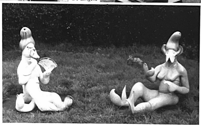
Le déjeuner sur l'herbe