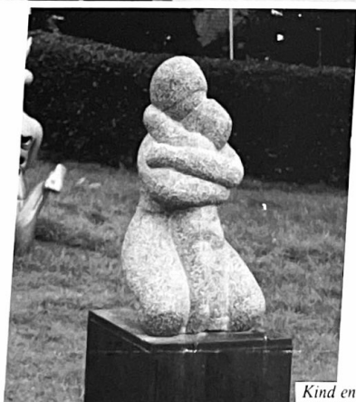
Kind en moeder