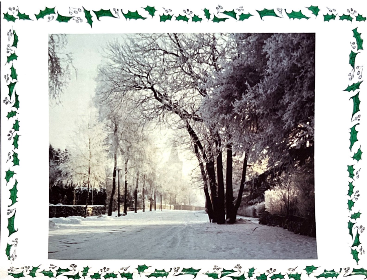
Deze vierkleurendruk is een Kersttintie, aangeboden door onze Hei & Wei-drukkerij J. van Gestel & Zn. B.V.