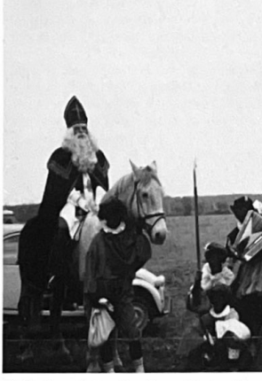
Als het Kerstmis is en kort daarop 'Oud en Nieuw', lijkt heel het verrukkelijk hollands Sinterklaasfeest weer mijnever achter ons te liggen. En dat is maar goed ook, want over 11 maanden is 'hij' er weer. Gelukkig. We kunnen dan weer net als dit jaar genieten van de ontelbare blijde snoetjes die met groete ogen de altijd een beetje 'spannende' gestalte in rood-en-goud aangapen, ervoor zingen en met gretige handjes de pepemoten en mandarijntjes van de vele zwarte Pieten ontvangen. Blaricum vergrijst? Ach wel nee, kom zelf maar kijken naar de Sinterklaasocht . . . . in 1989.

De foto werd genomen voor de boerderij van Gerit.