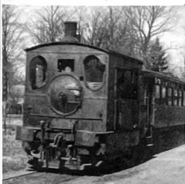
Onderwijl scharrelde de Gooise stoomtram door het oude Blaricum