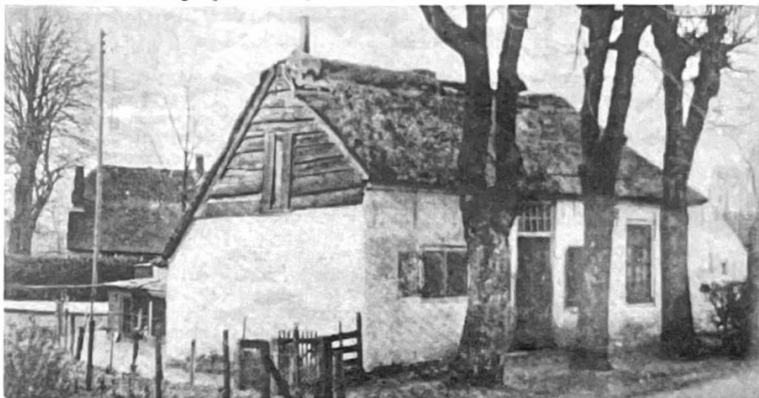
Een van de vele oude huisjes (1930)