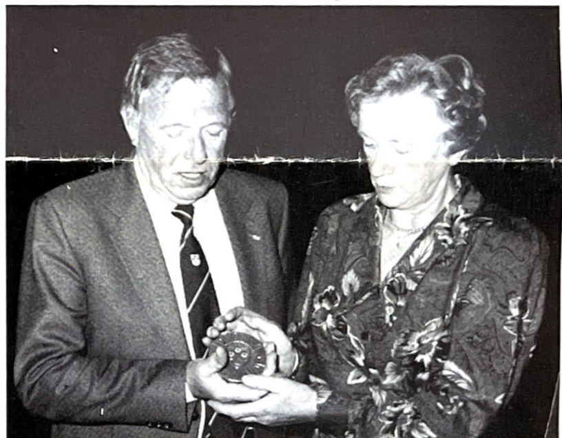
Hun handen koesteren de erepenning