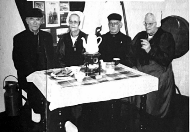
Een 3 à 400 wandelaars bezochten de open kerken, boedertjen en galeries op de Open Monumentendag in Blaricum, ook Blaricummers in klederdracht waren aanwezig