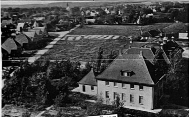
Panorama van Blaricum