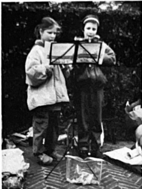
Op de Blaricummerie werd veel muziek gemaakt door groot en klein. Vooral "klein" was vertederend. Tussen de rommel en het vele publiek speelden zij onverstoorbaar. Komen zij in de toekomst in het Blaricum Orkest spelen?