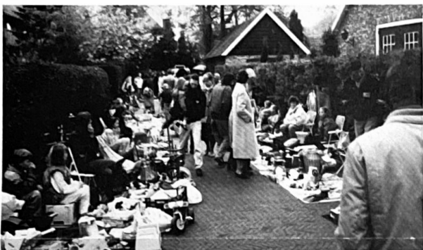
Het animo voor de kinder(ruim)markt wordt ieder jaar groter. Ze gaan de zijstraten al in! Hebben wij soms teveel rommel in Blaricum?