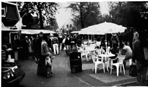
Kramen en terrassen, alles was 'in' op Koninginnedag 1991, ook was was het een beetje guur door een koude wind, maar dat deert een Blaricummer niet, want van een goed feest word je vanzelf wel warm!