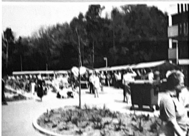
Zaterdagavond 11 mei 1991 een open gemeentebestuur. Veel publiek. Ook onder een zeldzaam stralend zonnetje. Het was een heel leuk moment voor iedereen van 20 tot 80 jaar. Het was een interessante avond. Niet alleen voor de kinderen van 10 tot 15 jaar, maar ook voor de ouders. Het was een heel leuk moment.