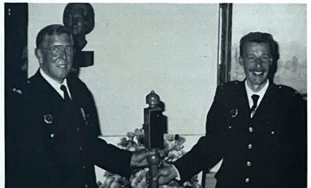
"Commandowisseling vrijwillige brandweer op 31 mei 1991 in de raadzaal van het gemeentehuis.