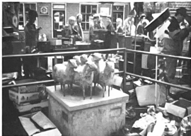
Kunst tussen kitsch