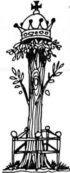
tekening Rolf Kok

Maar die lieve oude linde, hoek Raadhuisstraat/Eemnesserweg is kennelijk zó oud, dat niemand meer weet ter ere van wie die daar werd neergezet. Een beetje ere en 'allegre' staat hij daar tussen het verkeer. Een hekje om hem heen zou aardig staan en dat heeft hij ook wel verdiend na al die jaren trouwe dienst