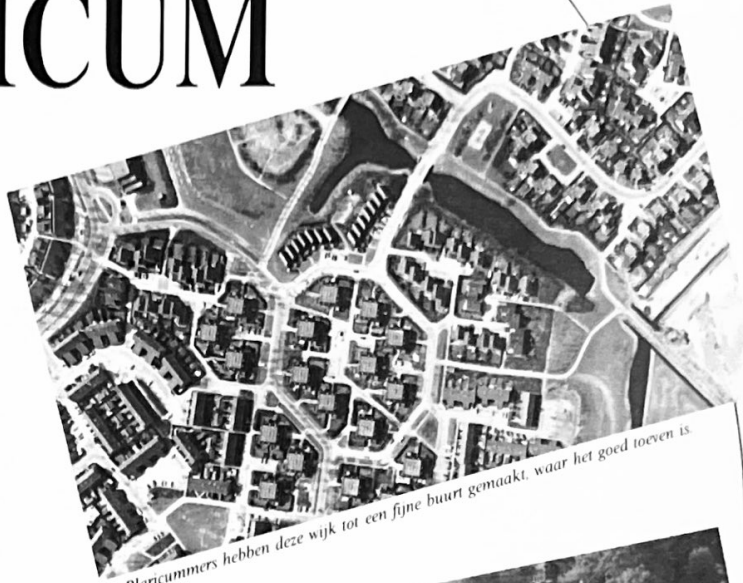
De Blaricommers hebben deze wijk tot een fijne buurt gemaakt, waar het goed toeven is.