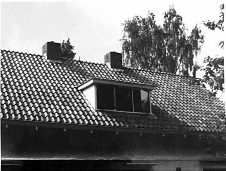
dakkapel op het achterdakkvlak...meldingsplichtig

Uw melding is een half jaar geldig. Indien u niet binnen een half jaar gebouwd hebt vervalt de melding.