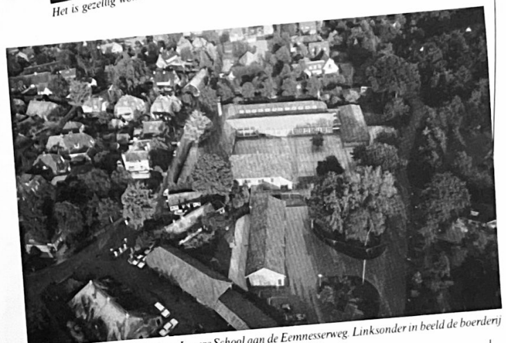
In het midden ziet u de Openbare Lagere School aan de Eemnesserweg. Linksonder in beeld de boerderij van Vos.