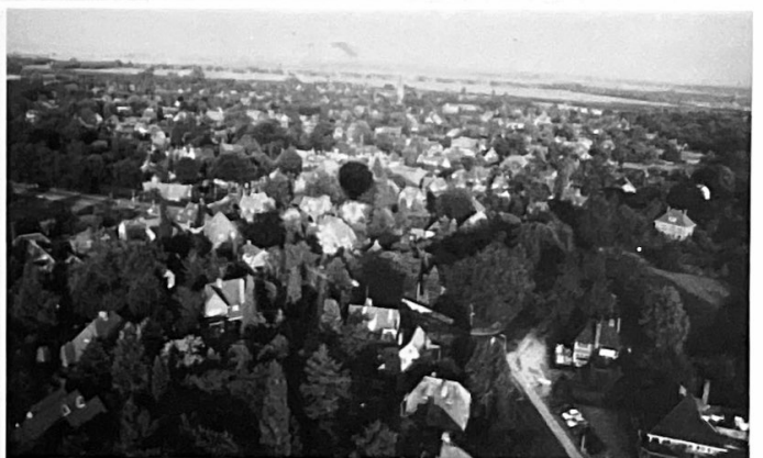
De donkere vlek in het midden van de foto is de schaduw van de luchtballon, van waaruit deze foto's zijn genomen op 3 juli 1990. Links ziet u de Bergweg en rechtsonder de Naarderstraat.

Straks is het mogelijk vergunningvrije bouwwerken op te richten zonder enig toezicht. Laten we proberen het karakter van ons mooie dorp en in het bijzonder het beschermde dorpsgezicht niet aan te tasten en plaats liever een mooie haag in plaats van een schutting. Wist u dat er geen kosten zijn verbonden aan het voorleggen van bouwplannen aan de welstandscommissie voor bouwwerken die vergunningvrij zijn? Voor meer informatie kunt u contact opnemen met de sektor ruimtelijke ordening en beheer.