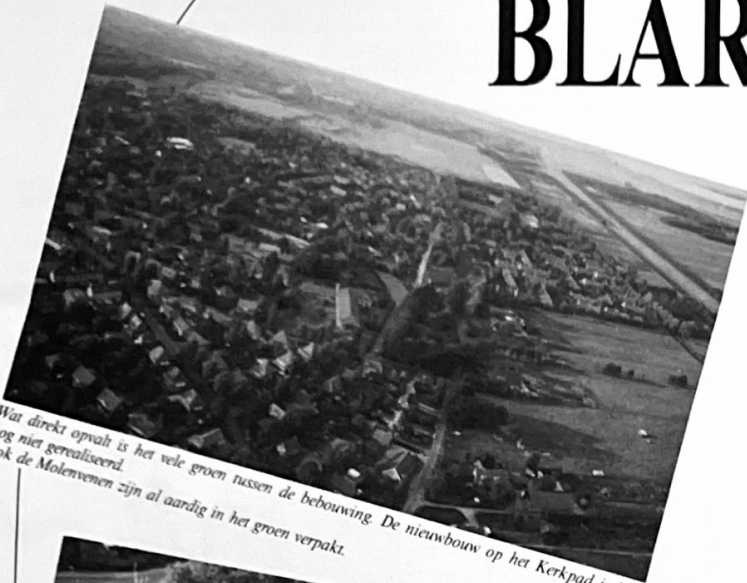
Wat direct opvalt is het vele groen tussen de bebouwing. De nieuwbouw op het Kerkpad is hier nog niet gerealiseerd. Ook de Molenvenen zijn al aardig in het groen verpakt.