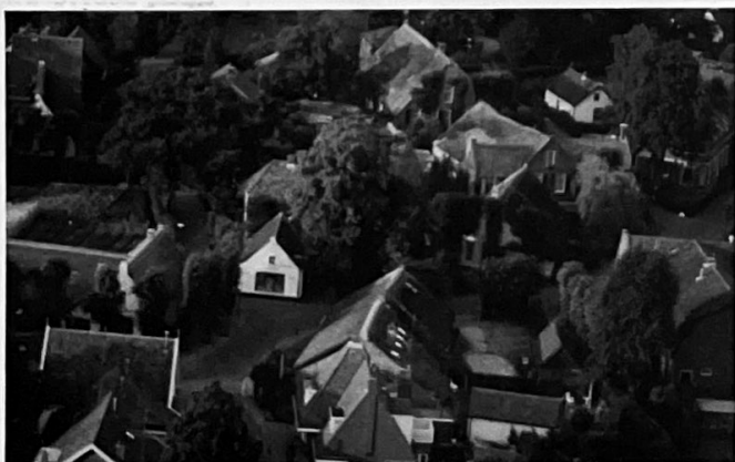
Zelfs in de dorpskern in het karakter van het groene dorp bewaard gebleven. De afwisselende bebouwing en open stukjes typeren ons mooie dorp.