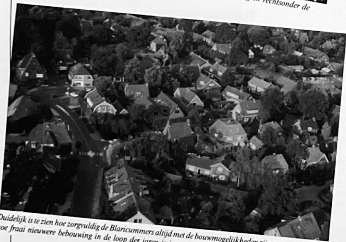
Duidelijk is te zien hoe zorgvuldig de Blaricommers altijd met de bouw mogelijkheden zijn omgegaan, hoe fraai nieuwere bebouwing in de loop der jaren is ingepast in de bestaande omgeving.