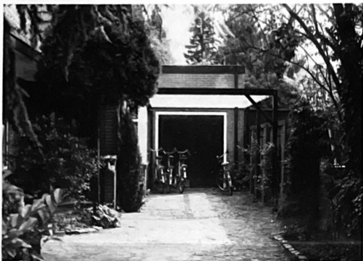
overkapping met open constructie...vergunningvrij

Vanaf 1 oktober 1992 geldt de nieuwe Woningwet, te zamen met het bouwbesluit. Aanvankelijk zouden deze wetten al op 1 juli a.s. in werking treden, doch de staatssecretaris liet onlangs weten de invoering te hebben uitgesteld tot 1 oktober a.s. Volgens de herziene Woningwet is niet in alle gevallen meer een bouwvergunning nodig. Soms kan worden volstaan met een melding en soms kan zonder meer worden gebouwd. Bouwvergunningen en meldingen moeten worden ingediend bij de gemeente waar zal worden gebouwd. Hiervoor heeft de gemeente formulieren beschikbaar. Ook zal altijd een tekening van de oude en de nieuwe situatie moeten worden overgelegd. De gemeente kan dan toetsen aan het bestemmingsplan, het bouwbesluit, de Monumentenwet en de bouwverordening. In bepaalde gevallen moet ook gekeken worden naar diverse milieuwetten. Daarom kan de gemeente niet direct uw aanvraag afdoen. Een bouwwerk moet altijd voldoen aan de eisen van het bouwbesluit. Dit besluit ligt ter inzage bij het gemeentelijk bouw- en woningtoezicht.