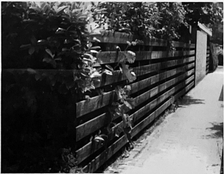
erfafscheiding achter de voorgevelrooilijn...vergunningvrij

Wanneer de woning of het gebouw een monument betreft is ALTIJD bouwvergunning nodig.