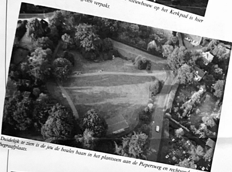
Duidelijk te zien is de jeu de boules baan in het plantsoen aan de Piepersweg en rechtsonder de begraafplaats.