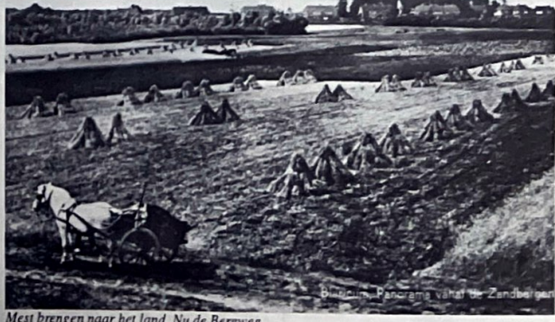
Mest brengen naar het land. Nu de Bergweg