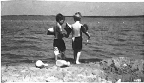
Blaricum aan zee!