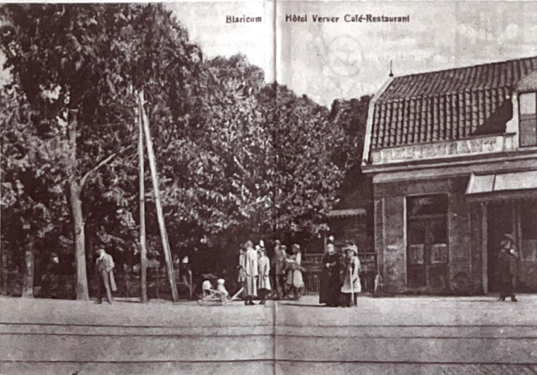
Halte van de eens zo beruchte Gooise Tram voor Hotel-Restaurant Verver waar het in 1920 ondanks de 'drukte' minder gevaarlijk was.

Vindt u dit misschien een te spontaan voorstel? Persoonlijk ben ik van mening dat belangstellende en belanghebbende dorpsgenoten er recht op hebben dat deze kwestie werkelijk met ernst en diepgaand behandeld wordt.