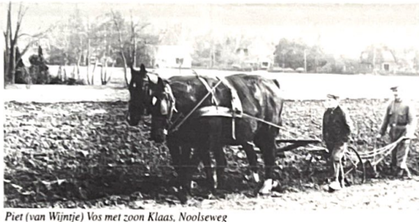
Piet (van Wijnje) Vos met zoon Klaas, Noolseweg

Kronkelige weggetjes, hoge beuk- of hulsthagen vormen het decor waarin de boerderijen liggen. Een aantal worden nog bewoond door boeren en die oefenen er hun boerenbedrijf uit. "Blaricum geen museumdorp! Blaricum moet het agrarische karakter behouden", aldus een vroegere uitspraak van oud-burgemeester A. Le Coulre-Foest. Om dit agrarische karakter te bewaren heeft zij destijds geijverd een agrarisch stichting in het leven te roepen met het doel boerderijen en landbouwgronden te behouden. Zo geschiedde. Enkele boerderijen met landbouwgronden zijn in de stichting ondergebracht. De boerderijen zijn verpacht. Voor de boerderij van de stichting aan de Eemnesserweg is een originele boerentuin aangelegd. Ook het huidige gemeentebestuur is zich terdege bewust van haar taak het agrarische karakter van ons dorp te bewaren.