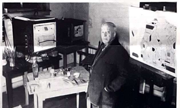
Bart van der Leek in zijn atelier in 1952.

Volgens tot nu toe verkregen gegevens is het huis in 1919 gebouwd. Het eerste gedeelte met atelier was toen klaar. Later kwam er een muziekkamer bij, toen de oudste dochter een vleugel kreeg. Ook kwam er een tweede atelier. Het eerste atelier werd nodig als huiskamer voor het gezin met inmiddels drie kinderen.