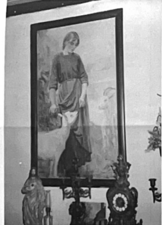
Foto van Katrientje op een schilderij van Johan Meier (rond 1930)