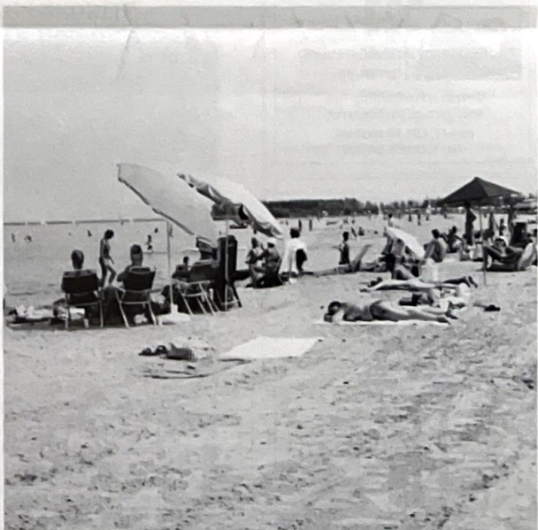
Nog even een terugblik. Het strand van Blaricum was zeer in trek tijdens de tropische dagen.